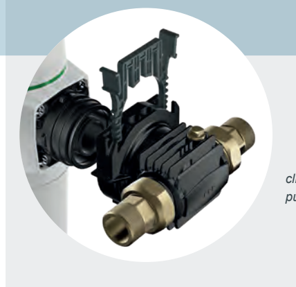
cliQlock-Anschluss pureliQ X-Baureihe

Eine absolute Neuheit und in der Wasser-aufbereitung exklusiv nur bei Grünbeck ist der Einsatz von cliQlock-Klammern. Mit dem formschlüssigen Design werden im werkzeuglosen cliQlock-Modulsystem herkömmliche Verschraubungen ersetzt. Die Vorteile für jeden Handwerker liegen auf der Hand: Optimaler Kraftschluss durch Umschließung des Bauteils um nahezu 360 Grad und eine Installation, die nur noch wenige Sekunden dauert. Das spart nicht nur Zeit, sondern auch Ressourcen sowie aufwendige und teure Rohrleitungsarbeiten – klick und dicht.