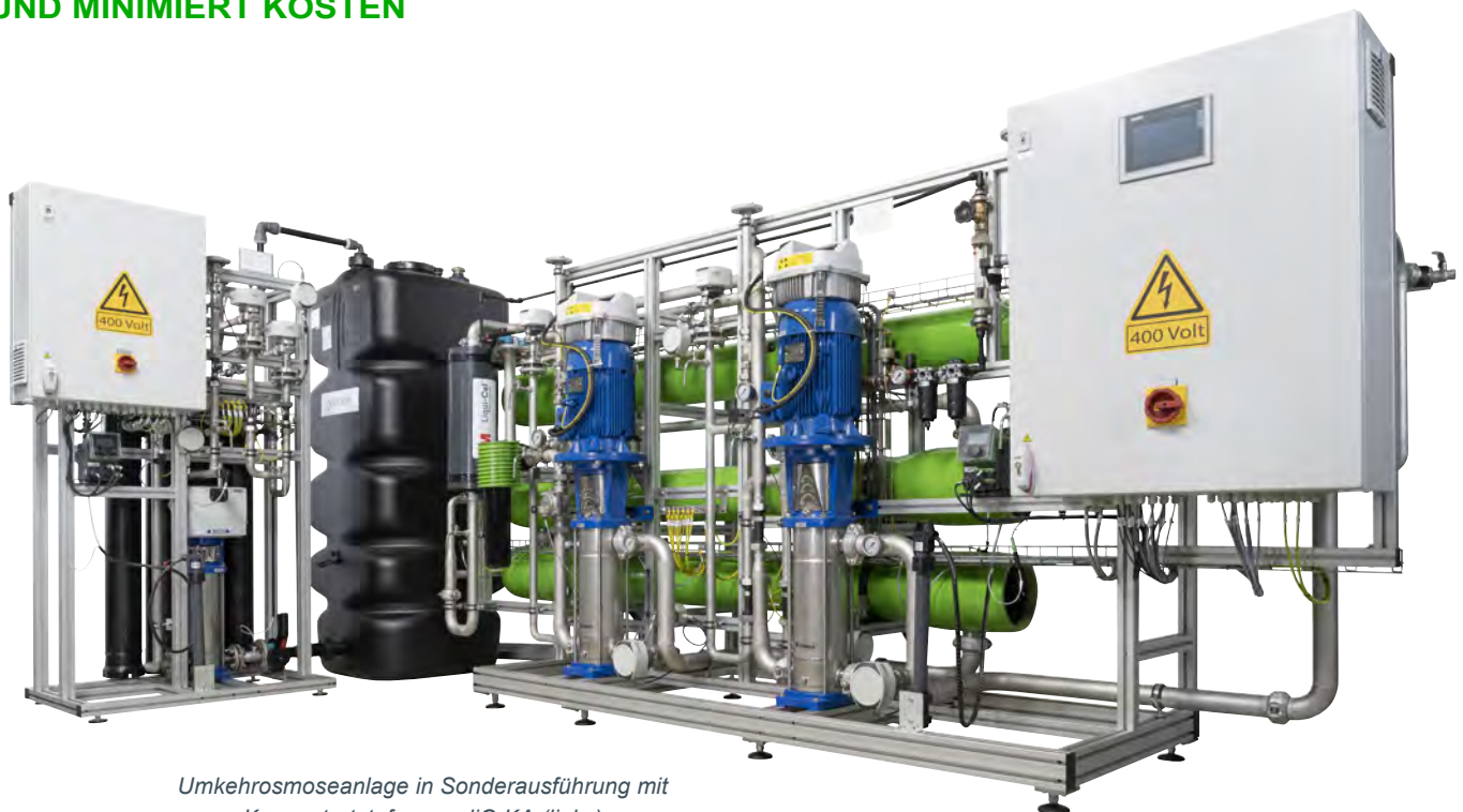
Umkehrosmoseanlage in Sonderausführung mit Konzentratstufe osmoliQ:KA (links)