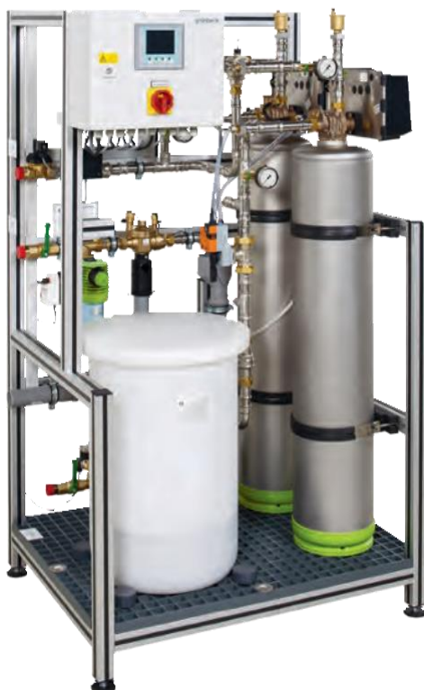
Teilstromfilter GENO-VARIO 3000

Die Teilstromfiltration GENO-VARIO 3000 ist über unseren Mietpark erhältlich!