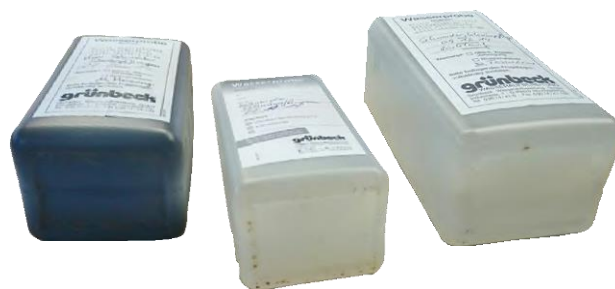
Von links nach rechts: Probe vor Inbetriebnahme der Teilstromaufbereitung (linke Abbildung), nach 4 Wochen (mittlere Probe) und nach weiteren 4 Wochen. In der letzten Probe sind praktisch keine Partikel mehr vorhanden.

Die Teilstromfiltration GENO-VARIO 3000 ist auch über unserem Mietpark erhältlich!